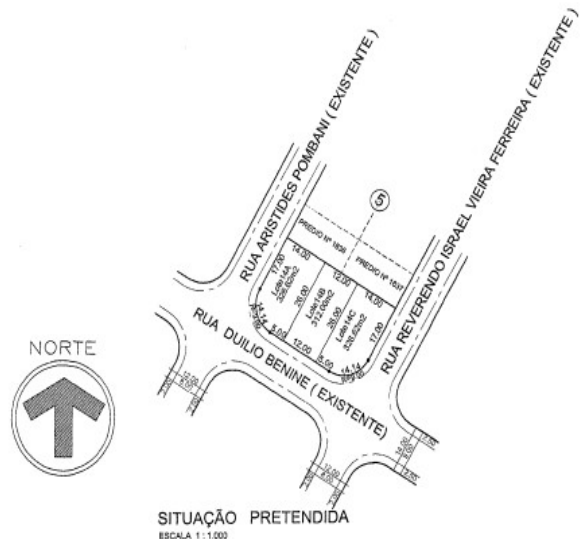
SITUAÇÃO PRETENDIDA ESCALA 1:1.000

PREFEITURA MUNICIPAL DE PIRASSUNUNGA ANEXO AO DECRETO Nº 6.993 Pirassununga, 25 OUT 2017